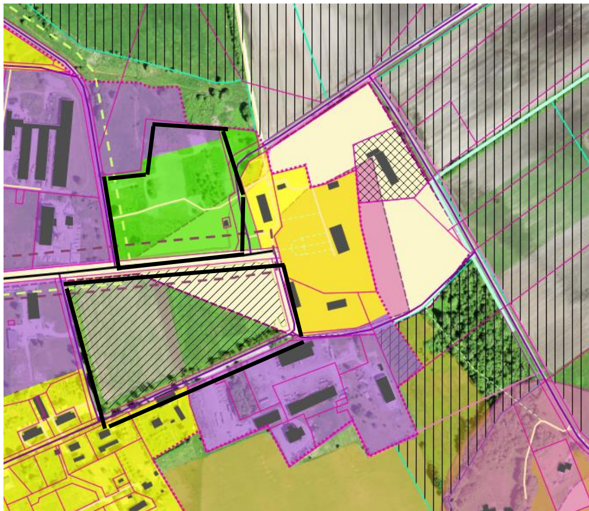
Ioonis 1. Väljavõte Saue valla üldplaneeringust (Mõisa tee 23 ja Õismäe katastriüksused)

Mõisa tee 23 kinnisasja tootmismaa juhtotstarbega maa-ala muutmine üldkasutatavaks maaks ning maa-alale avalikkusele suunatud multifunktsionaalse spordiväljaku, halastuse, jalgradade kavandamine ning juurdekuuluvate rajatiste rajamine on kooskõlas valla üldplaneeringuga.